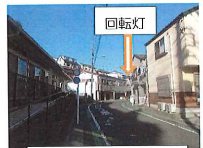
いこいの家側待機場所